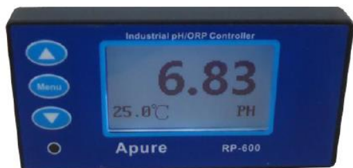
Model : RP-600